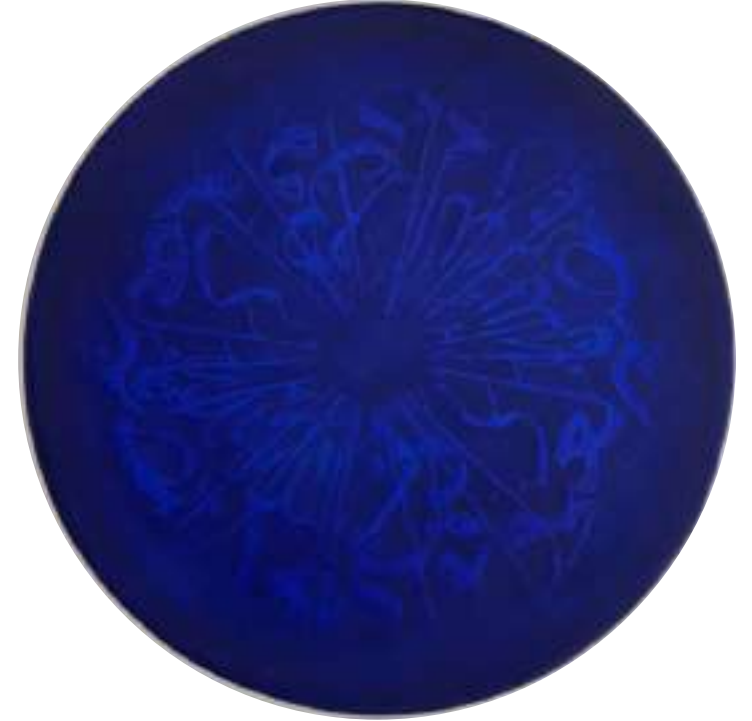
SURET AL EKHLAS 1

قُلْ هُوَ اللَّهُ أَحَدٌ (1) اللَّهُ الصَّمَدُ (2) لَمْ يَلِدْ وَلَمْ يُولَدْ (3) وَلَمْ يَكُنْ لَهُ كُفُوًا أَحَدٌ (4) { سورة الإخلاص }