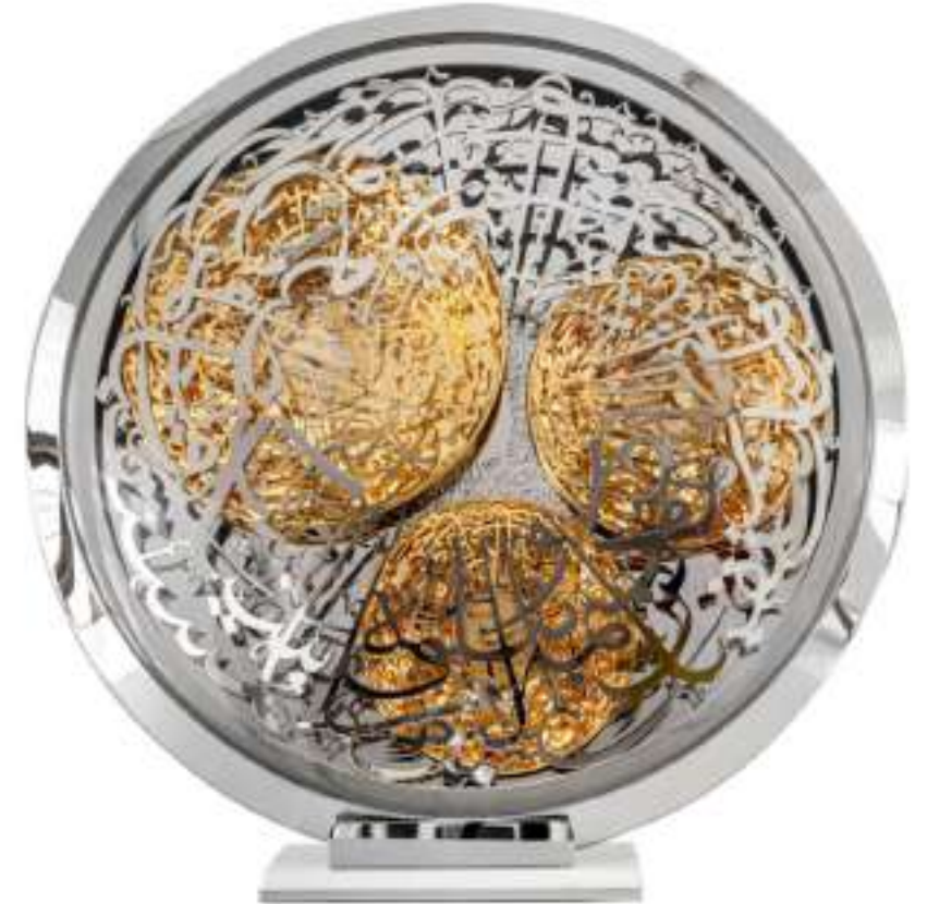
THE CALLIGRAPHY CLOCK

الزمن هو العلامة الفارقة في الحياة، هو الصورة التي نقرؤها في حالة غير منتهية، لا ندرك الماضي بيدنا وإن انفلت، ولا نعرف كيف المستقبل وإن ارتقبناه، فكان العمل النحتي هنا يرمز لمرور الزمن، التاريخ والحياة، مرور غير منتهي، يحمل في جنباته كل الرموز والمنجزات والأقوال التي تلامسنا، الساعة هي حالة من الحفاظ على كل المحتويات والتمسك بها، مستمرة بذلك بعطاء هذا الشعب وتضحياته، في كل المجالات والأوقات بلا توقف في عملية مستمرة وبذل بلا حدود. كما أن الرموز التي ستكون منها الساعة هي ركائز في الدولة ويعتني بها قادتنا، هي ركائز شمولية تجمعت معا لتكون منتجاً هي أساس للمؤسسة، هذه الركائز تتركز في الولاء، السعادة، التاريخ، الإنجاز، الثقافة، الحنكة، الهدف، المبادرة، التميز، الابتكار، النوعية والسلم، أصبح العمل بهذه الركائز ذو قيمة تناغمية ثقافية ينبع من حالة ابتكارية في نوعية الهدايا التي يقدمها الفنان اليوم.