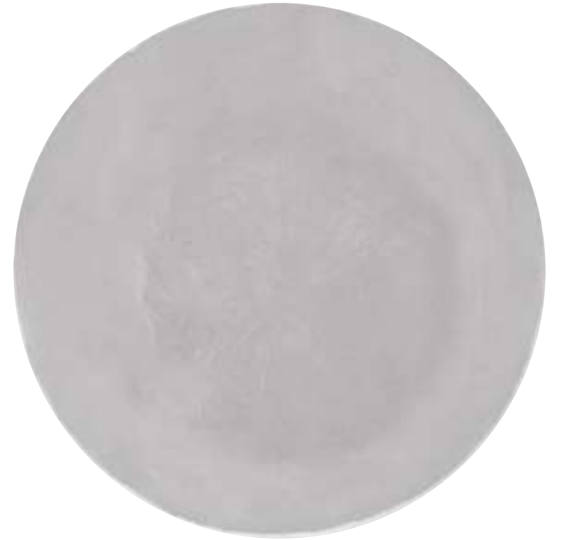
SURET AL EKHLAS 3

قُلْ هُوَ اللَّهُ أَحَدٌ (1) اللَّهُ الصَّمَدُ (2) لَمْ يَلِدْ وَلَمْ يُولَدْ (3) وَلَمْ يَكُنْ لَهُ كُفُوًا أَحَدٌ (4) { سورة الإخلاص }