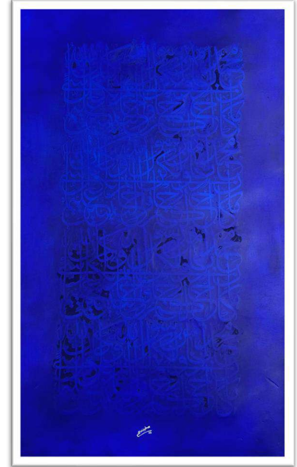
WALL ART CALLIGRAPHY

Width : 120 cm Length : 200 cm Medium : Mixed Media Year : 2022